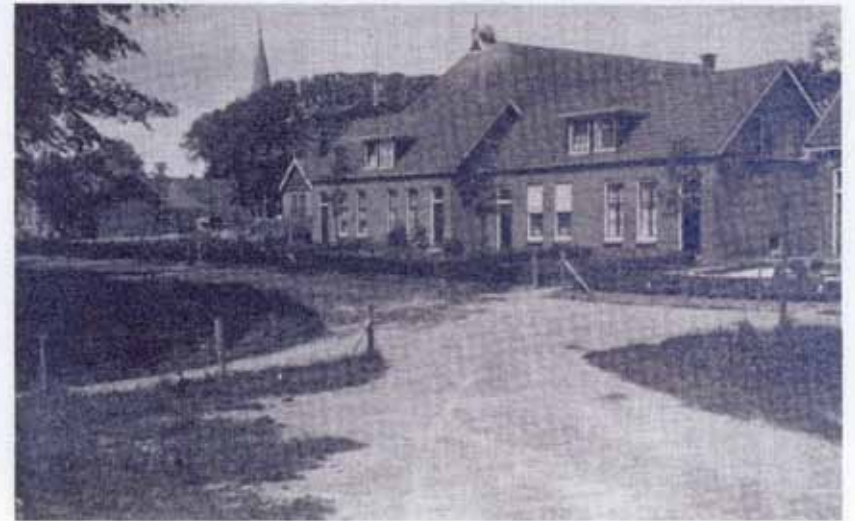
Metslawier. Twee van de oudste woningwetwoningen aan de Achterwei (nu master fan Loanstrjitte). Op de achtergrond is de toren van de hervormde kerk nog net te zien. 1933.

Een bijzonderheid was dat er ieder jaar op het dak van de schuur door een paartje ooievaars twee jongen werden grootgebracht. Door de stand, midden in het dorp, kon overal het z.g. klepperen van de vogels worden gehoord. Dan zien we op een foto uit 1933 dat de boerderij er nog staat met aan de linkerkant een los schuurtje dat daar nu rechts van het huis van Meindert Castelein als garage wordt gebruikt. Op deze foto zien we ook nog het ooievaarsnest boven op de boerderij.